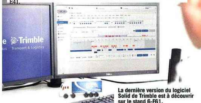
La dernière version du logiciel Solid de Trimble est à découvrir sur le stand 6-F61.

avec la FNTR et Transfollow pour l'intégration de la e-CMR à son application tablette, sur le stand 6-F61. Enfin, le groupe Alpega annonce des nouveautés à la fois pour Transwide (TMS) et Teleroute (bourse de fret). Le premier se voit doté d'une version mobile baptisée we-Track. Elle permet au conducteur de recevoir une commande transport. Il peut ensuite faire remonter en temps réel toutes les informations utiles : bonne exécution de la livraison, transmission des documents, incidents divers, etc. La seconde voit apparaître une nouvelle fonctionnalité de demandes de cotations en lien avec Transwide, ainsi que d'un système de classement. Alpega vous attend sur le stand E41.