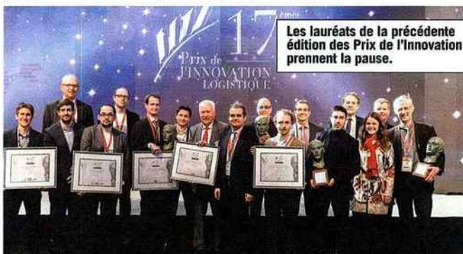
Les lauréats de la précédente édition des Prix de l'Innovation prennent la pause.

Le mercredi 21 mars, à 18 heures, se tiendra la cérémonie des Prix de l'innovation, visant à récompenser les exposants dont les produits sont les plus novateurs. Ainsi, 6 prix seront remis aux différents acteurs qui se sont portés candidats, répartis selon les catégories suivantes : Service transport et logistique, équipement de transport, technologies et systèmes d'information, infrastructure ou site logistique, et start-up contest. Ce dernier revient sur le salon pour sa 3 e édition. Il témoigne de la dynamique des entrepreneurs qui imaginent le transport et la logistique de demain. La finale de ce concours tremplin se déroulera le vendredi 23 mars à 12 h. Parmi les candidats des Prix de l'innovation, on retrouve, entre autres, Star's Service, Barjane, Geoconcept, Honeywell, Neoditech, ou encore Exotec solutions, qui viendront présenter leurs dernières nouveautés. Quant au jury, il sera composé de 18 décideurs du secteur transport-logistique (directeurs supply chain, logistique et achats pour la grande majorité).